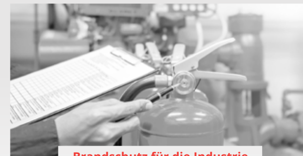
Brandschutz für die Industrie

R. Lachmann GmbH Industriestrasse 52a • 67227 Frankenthal Tel. 0 62 33 / 78 51 • info@lachmann-brandschutz.de