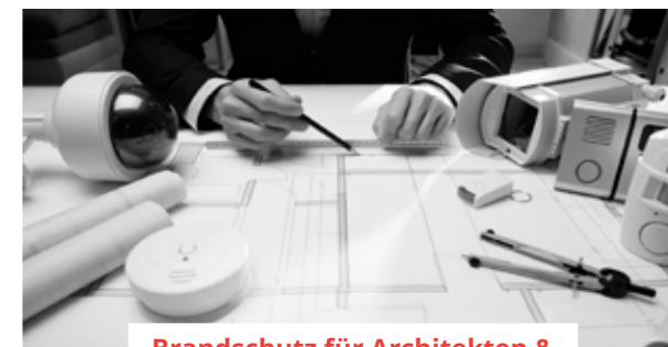
Brandschutz für Architekten & Bauherren